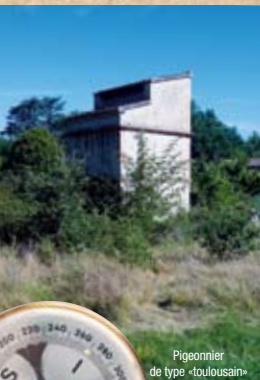
Pigeonnier de type «toulousain»